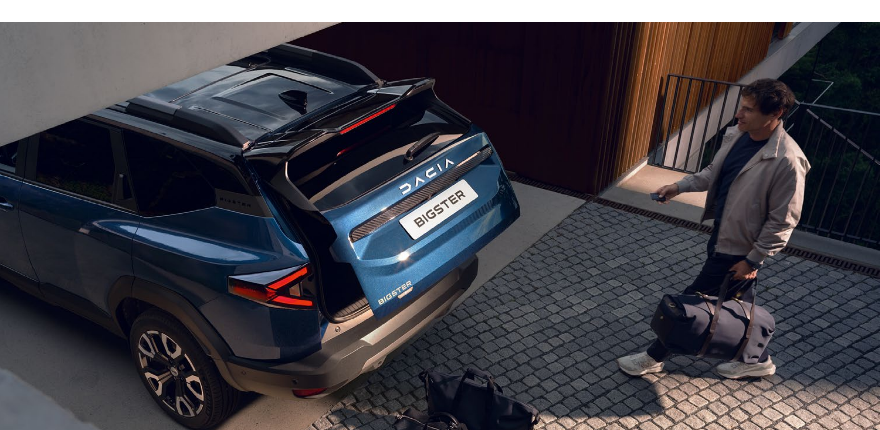
Električna prtljažna vrata