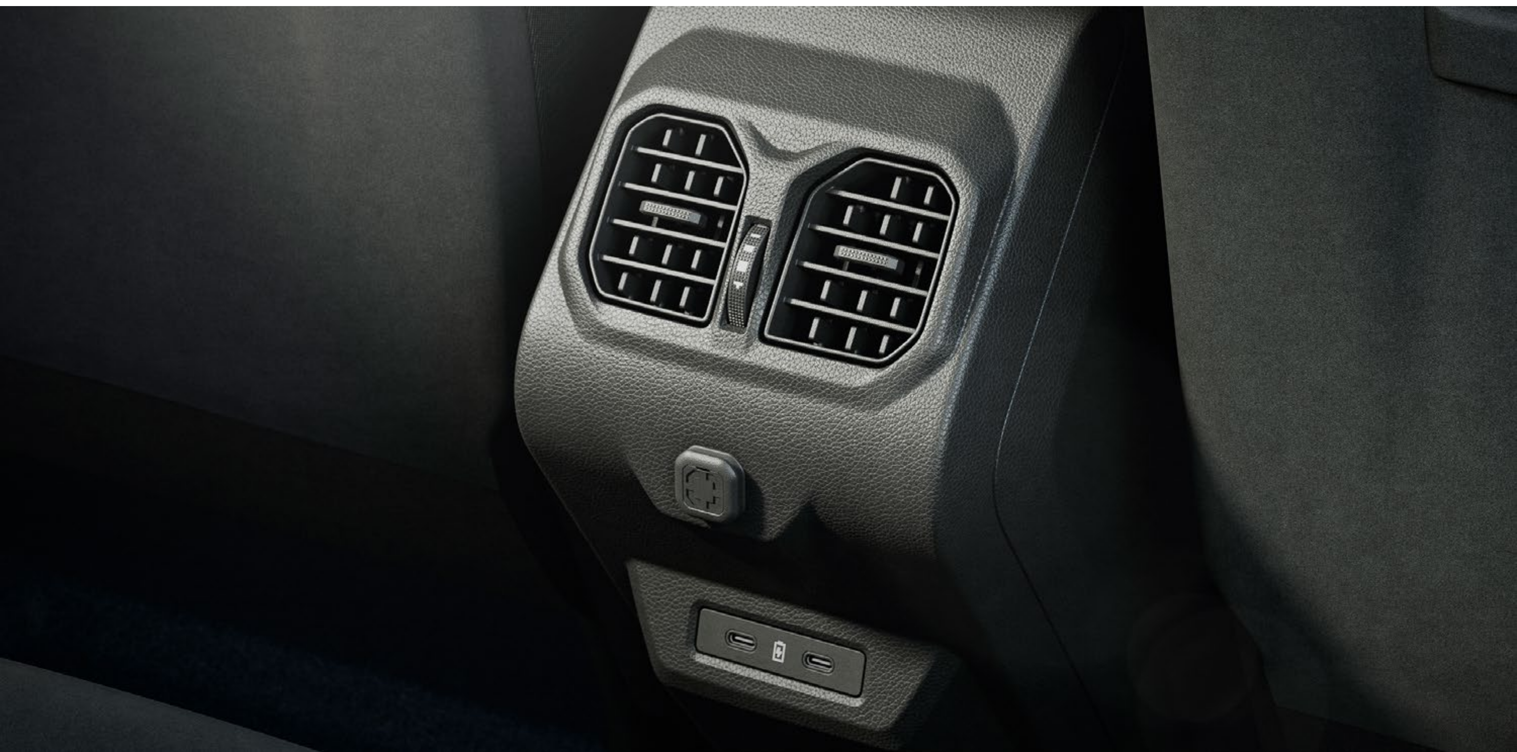
Zračniki za zadnje sedeže