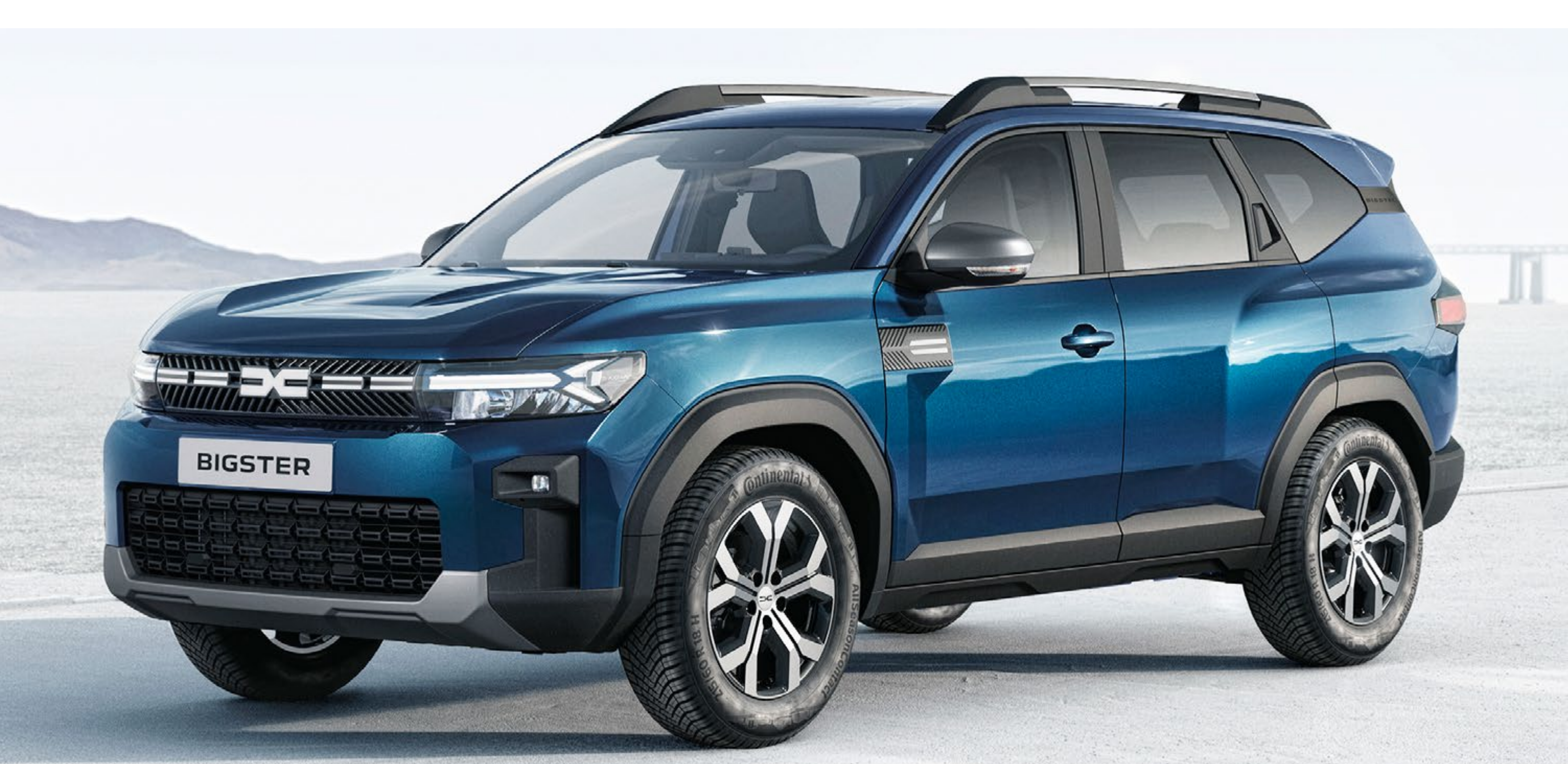
INDIGO MODRA (2)