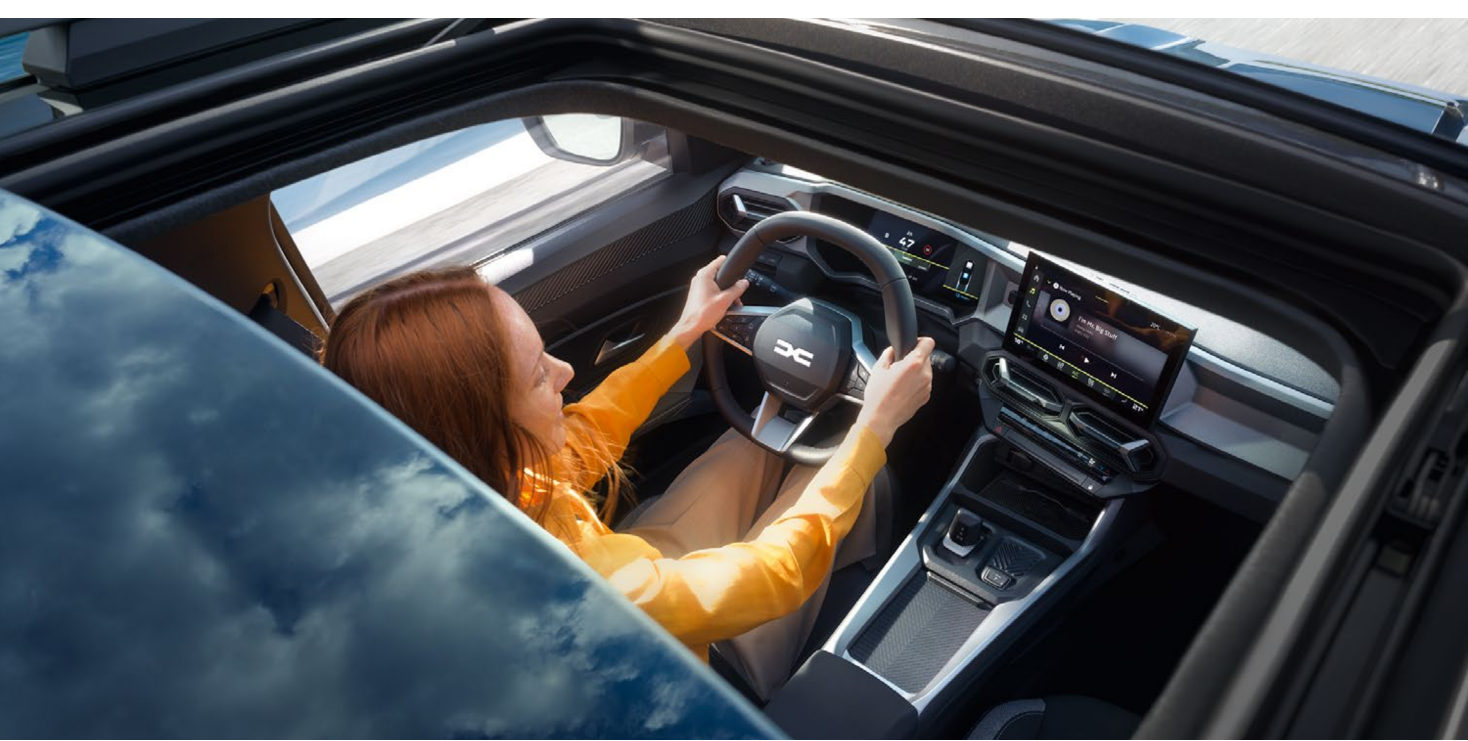
Pomično panoramsko strešno okno

Dvobarvna različica izžareva sproščeno eleganco. Pomično panoramsko strešno okno, ki zagotavlja edinstveno svetlobo v notranjosti, in ekskluzivna modra barva Indigo vozilu podarjata še večjo prepoznavnost. Vsak si lahko izbere svoj Bigster.