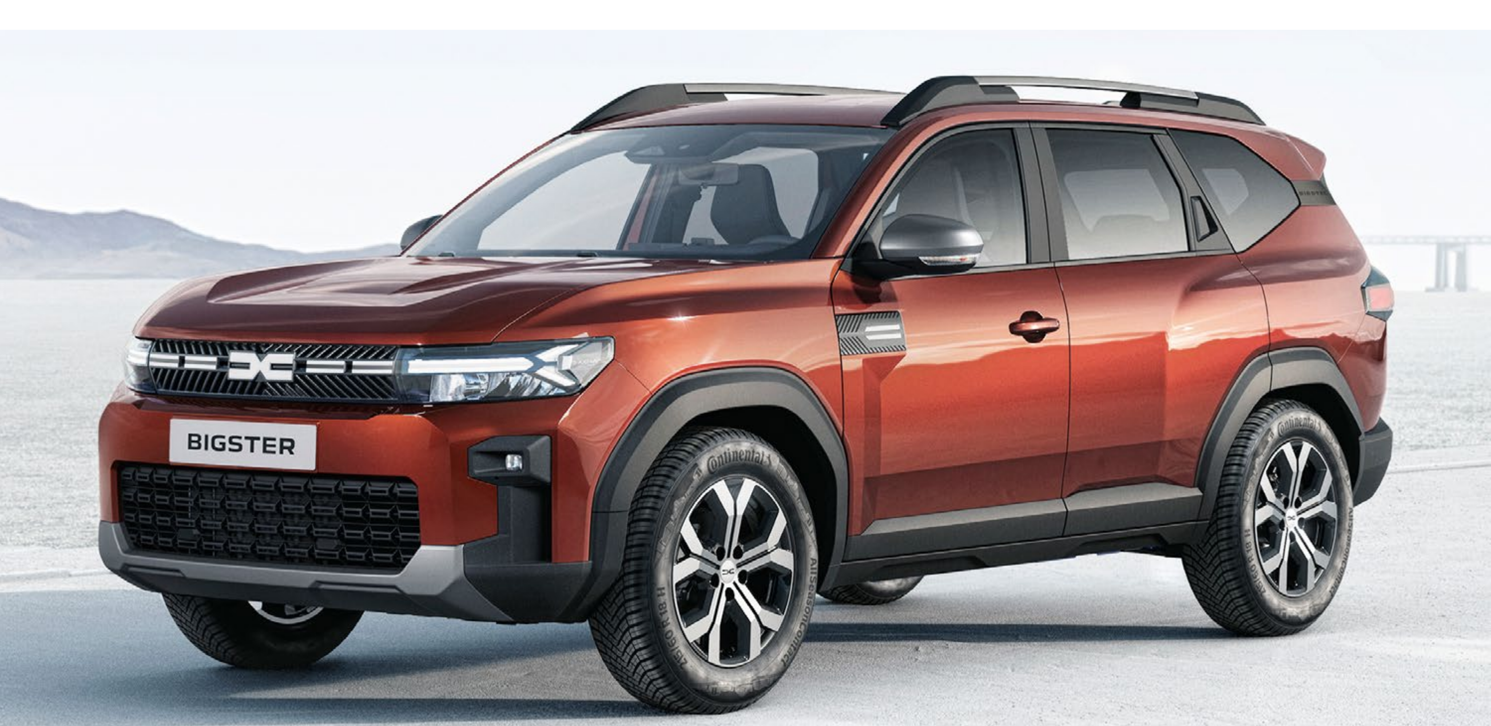
TERRACOTTA RJAVA (2)