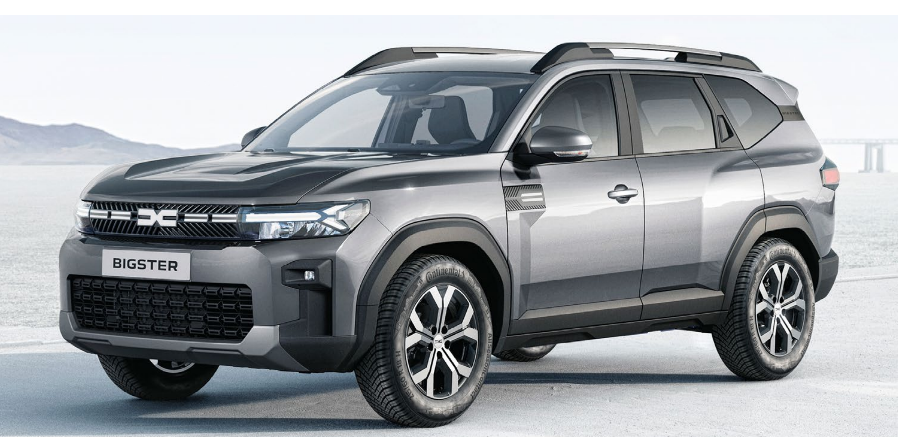
SCHISTE SIVA (2)