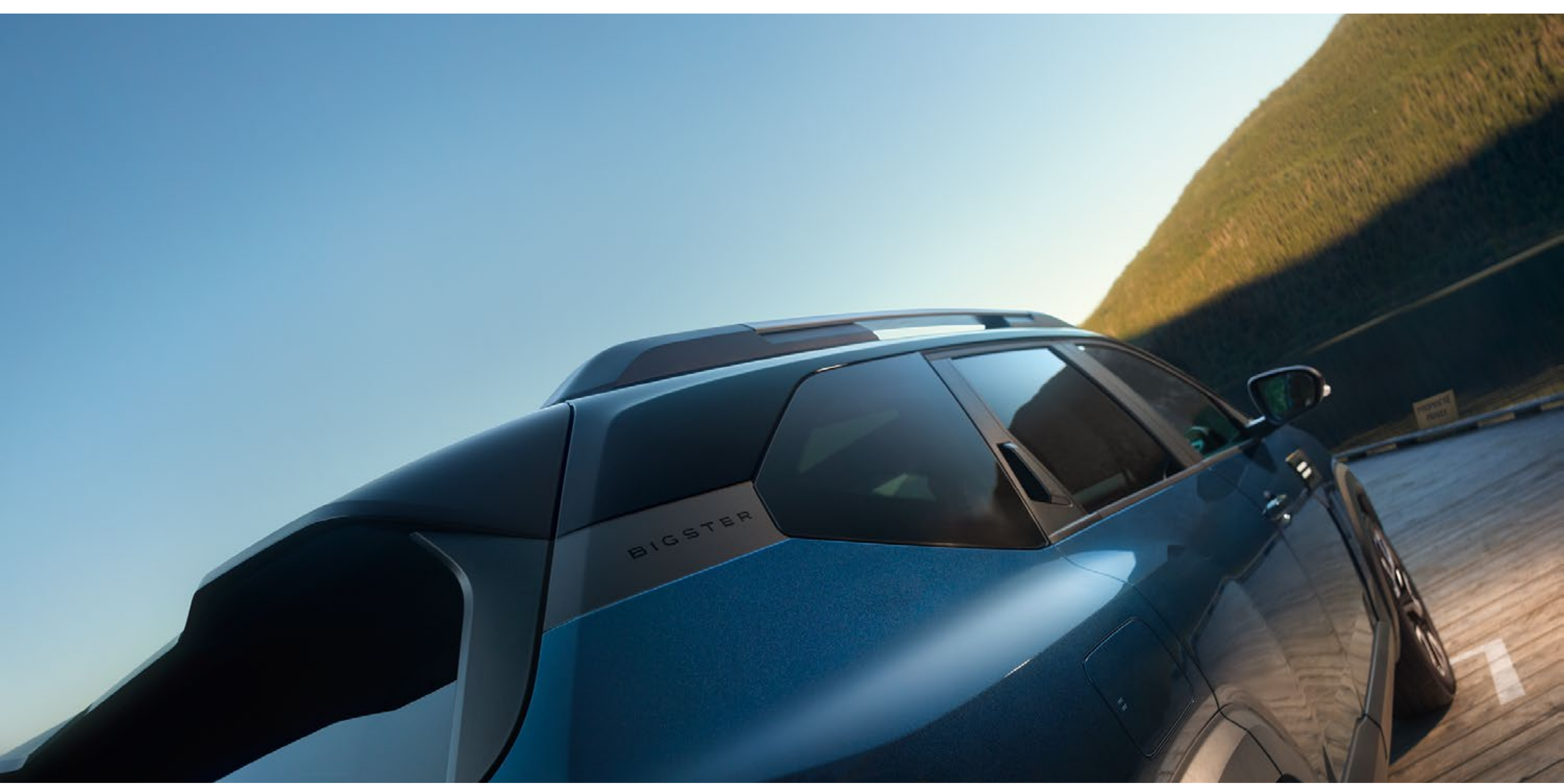
Ekskluzivna dvobarvna kombinacija