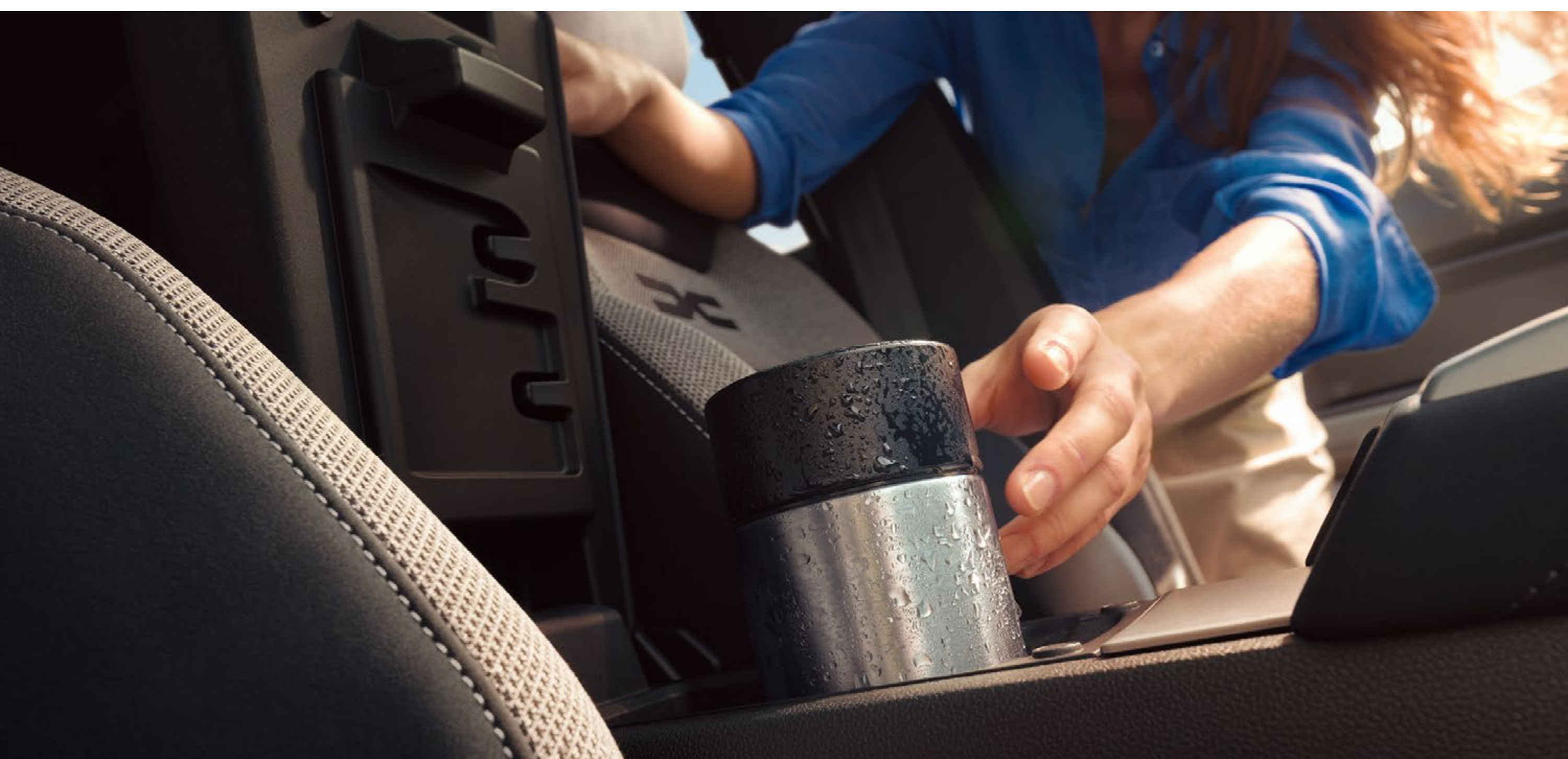
Prednji hlajeni predal

Preizkusite tudi domiselni pritrdilni sistem YouClip: pet točk, razporejenih po celotnem vozilu, z možnostjo dodajanja dveh dodatnih točk z držalom za namestitev na vzglavnik. Z njim lahko varno pritrdite ali namestite različne predmete (telefon, tablični računalnik, skodelico itd.).