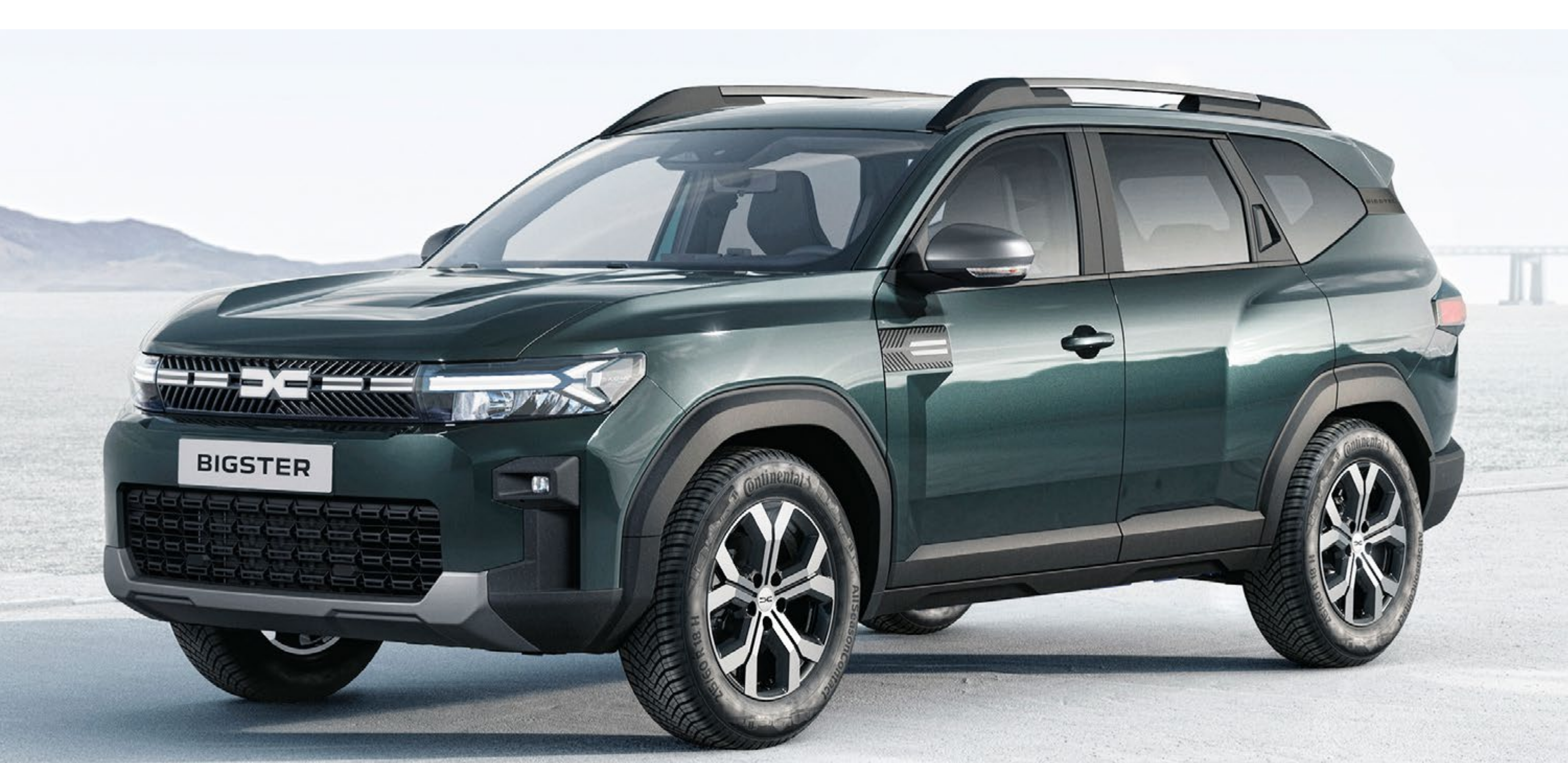
OXIDE ZELENA (2)