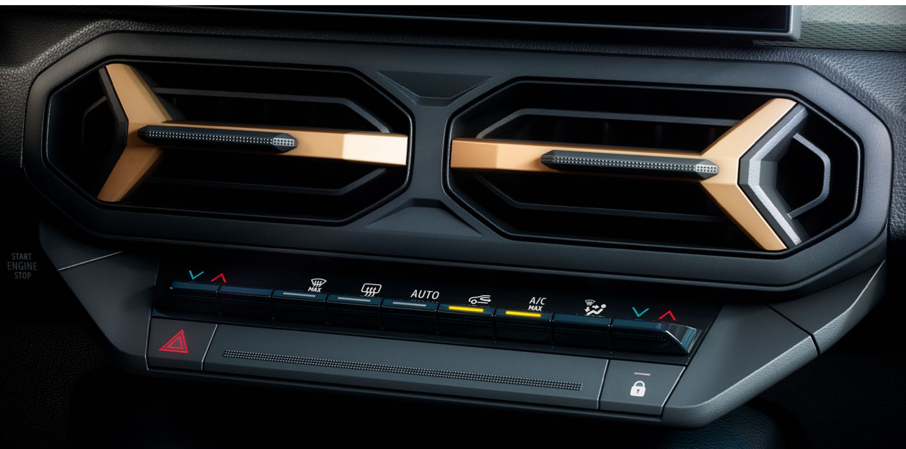
Sistem za dvopodročno ogrevanje in klimatiziranje zraka

Notranji ambient je zasnovan za užitek petih potnikov in vključuje nadzorovano zvočno izolacijo, tridimenzionalni zvočni sistem Arkamys® 3D s šestimi zvočniki ter prilagodljivo dvopodročno klimatsko napravo spredaj in zračnike zadaj.