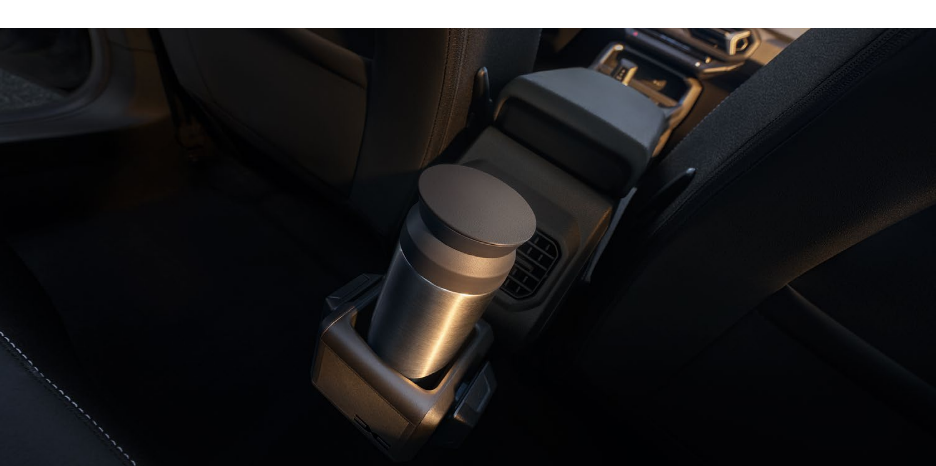
YouClip 3 v 1