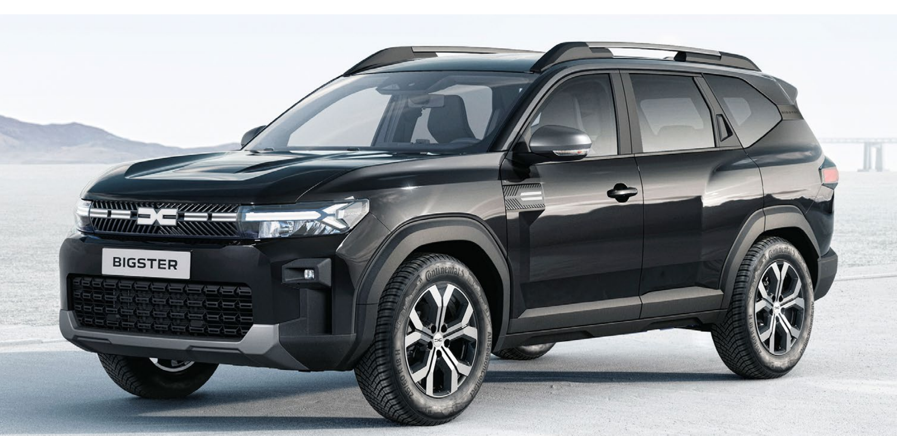
BISERNO ČRNA (2)