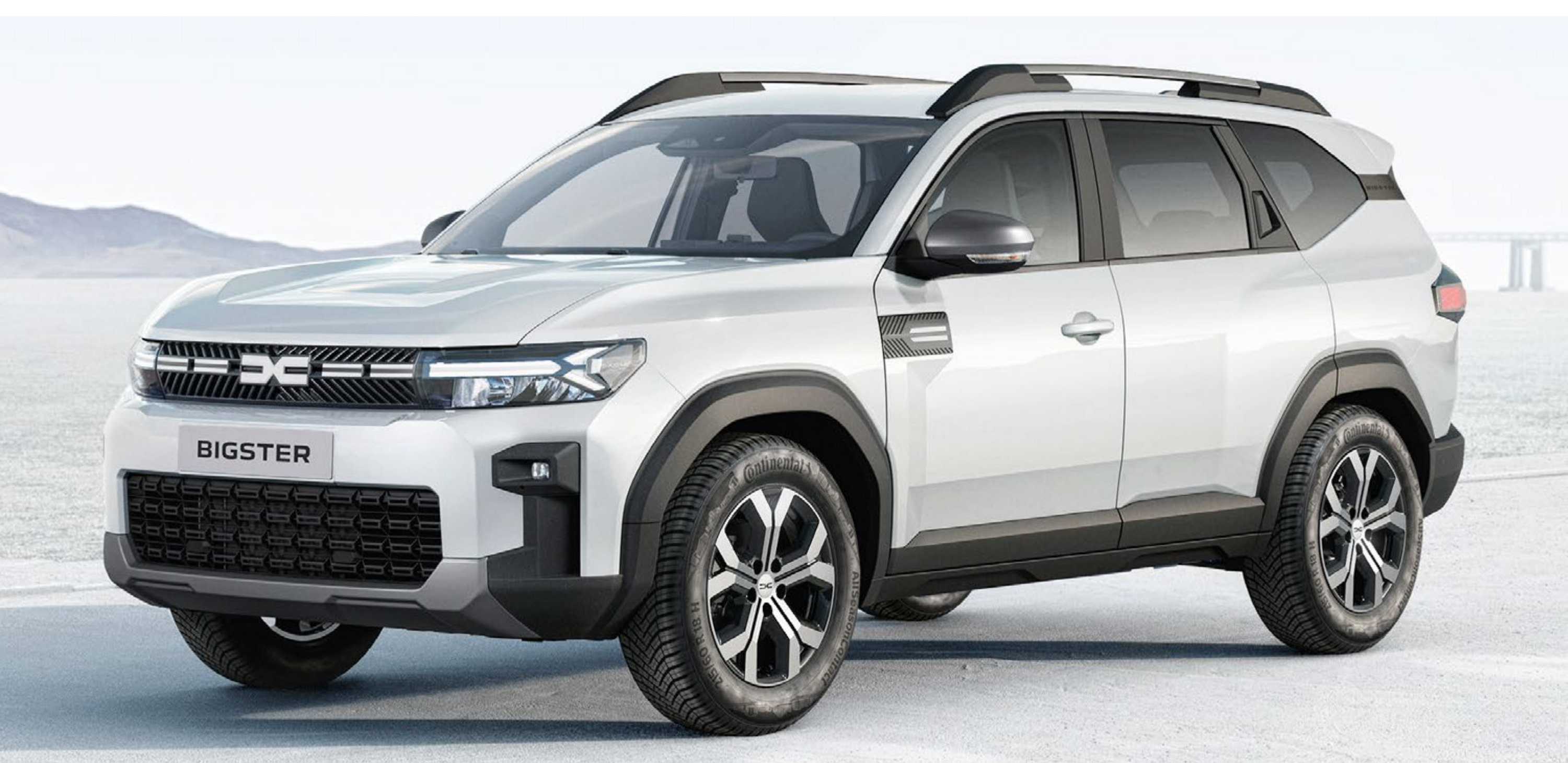
LEDENIŠKO BELA (1)